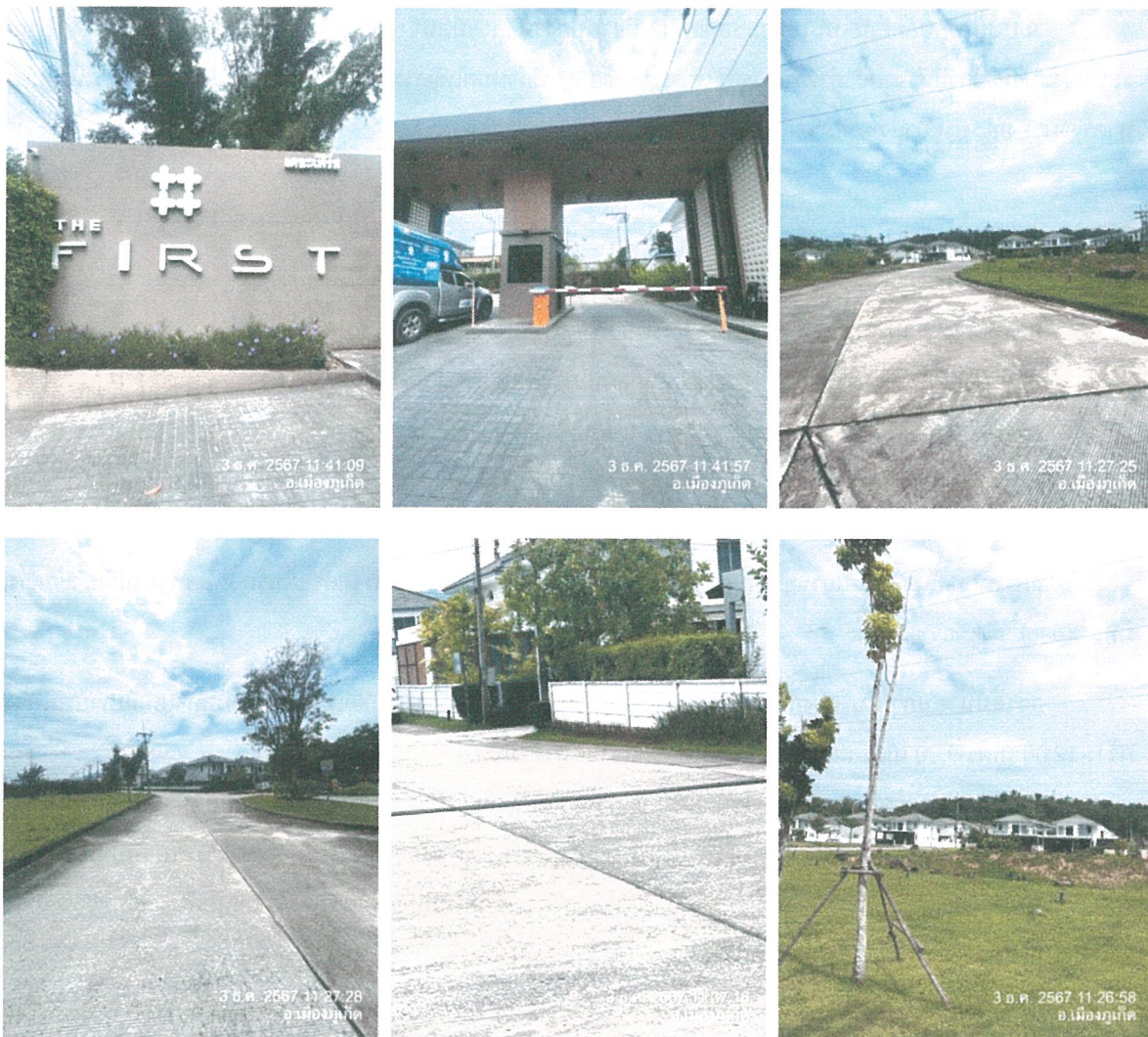
รูปภาพที่ 1.4 การใช้พื้นที่ของโครงการ